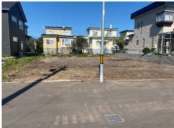
札幌緑小学校 徒歩8分 札幌北中学校 徒歩11分